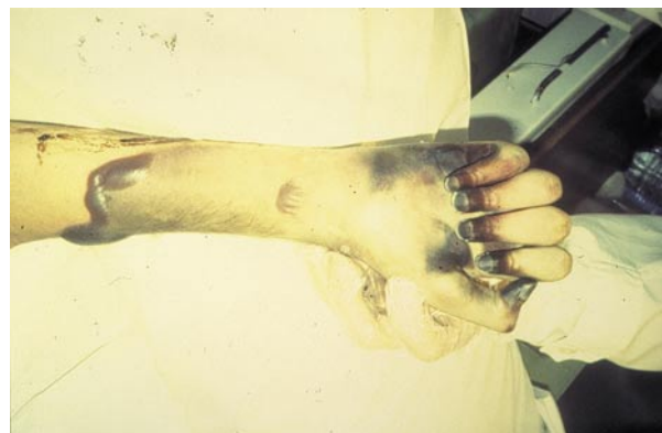
Figura 2. Necrosis y formación de flictenas en miembro superior izquierdo.

médico con vasodilatadores y trombolíticos, mejorando la perfusión en muslos y piernas, pero persistiendo el vasoespasmo en pies, con aumento de la intensidad cianótica, y con formación de flictenas (Figuras 1 y 2). Debido a la evolución local y a un síndrome febril prolongado se decidió efectuar la amputación a nivel infrapatelar de ambos miembros inferiores y del miembro superior izquierdo. El miembro superior derecho indemne se debió a que previamente había sido afectado por una herida de bala en el plexo homolateral, lo cual impidió la necrosis posterior del mismo por vasoespasmo. El aspecto macroscópico de los miembros inferiores en la anatomía patológica presentaba momificación digital y coloración azul-violácea que se extendía hacia cara dorsal y plantar, con esfacelo de la piel en la zona retromaleolar externa de ambos miembros. La piel de las piernas y la masa muscular no presentaban alteraciones tróficas objetivables.