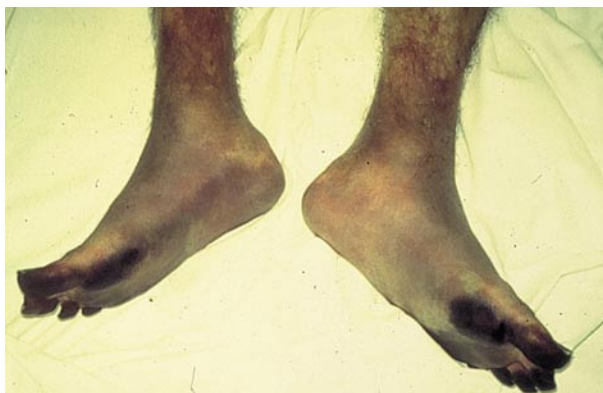
Figura 1. Isquemia y necrosis en ambos pies por vaso espasmo.