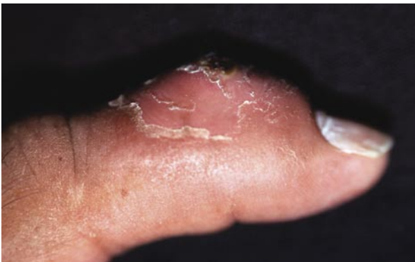
Figura 2. Vista lateral de la misma lesión.

pacidad laboral; no presentó ningún tipo de antecedente traumático y no relató ninguna otra lesión en otra parte del cuerpo. Acudió a consulta con diversos especialistas, tales como: traumatólogos, radiólogos, reumatólogos y micólogos, quienes le prescribieron diversos tipos de tratamientos como antibióticos (penicilina, cefalexina, clindamicina, ciprofloxacina), antiinflamatorios no esteroideos, antimicóticos (nistatina e itraconazol) y colchicina sin obtener una buena respuesta con ninguno de ellos.