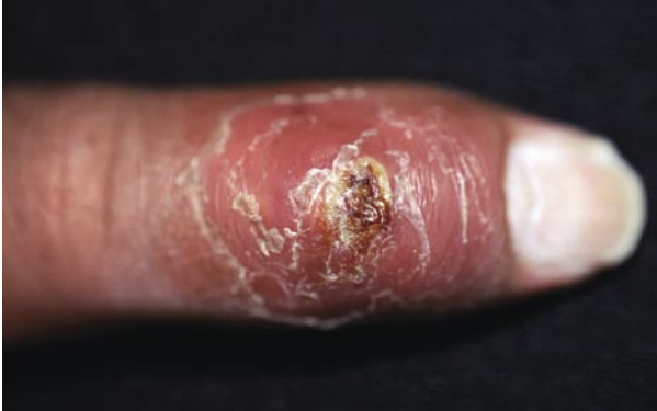
Figura 1. Lesión nodular ulcerada en dedo índice izquierdo.