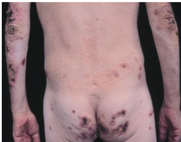
Figura 1. Lesões úlcero-necróticas de aspecto angular.