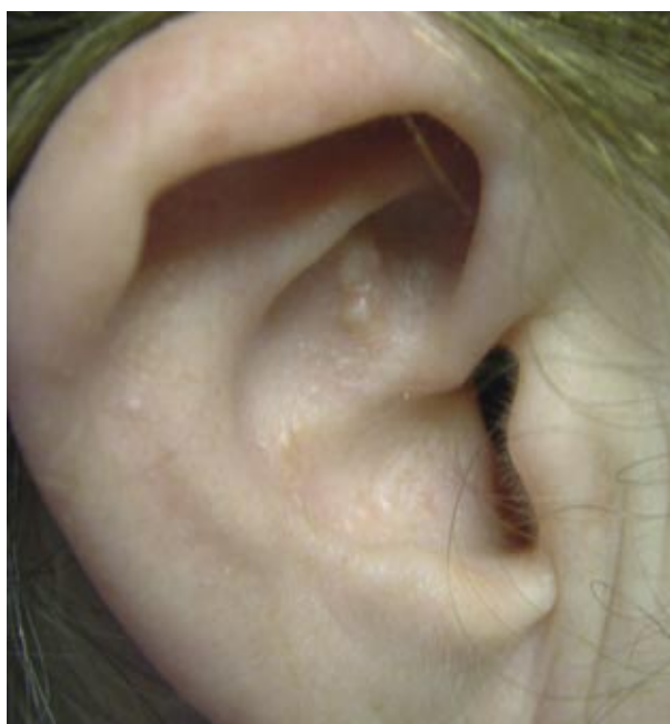
Figura 1. Pápulas amarillentas en la concha auricular.

El millium coloidal es una enfermedad por depósito de la que se conocen tres variedades clínico – patológicas[1,2]: el millium coloidal del adulto, millium coloidal juvenil y el millium coloidal pigmentado asociado al uso de hidroquinona. Las variantes denominadas millium coloidal nodular y paracoloide se consideran en las amiloidosis[2].