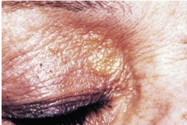
Figura 1. Milia múltiple sobre una placa eritematosa en canto interno de párpado derecho.

La presencia de 2 o más sitios comprometidos es excepcional y fue reportada por Le Guyadec et al.[10]. En su caso, como en el nuestro, ambas regiones retroauriculares y el canto interno del párpado estaban afectados.