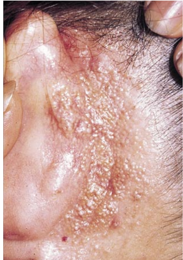
Figura 2. Placa eritematosa en región retroauricular derecha, repleta de múltiples millium.

Tretinoína tópica, electrodesecación, criocirugía, laser de CO 2 , enucleación quirúrgica de los quistes y minociclina oral