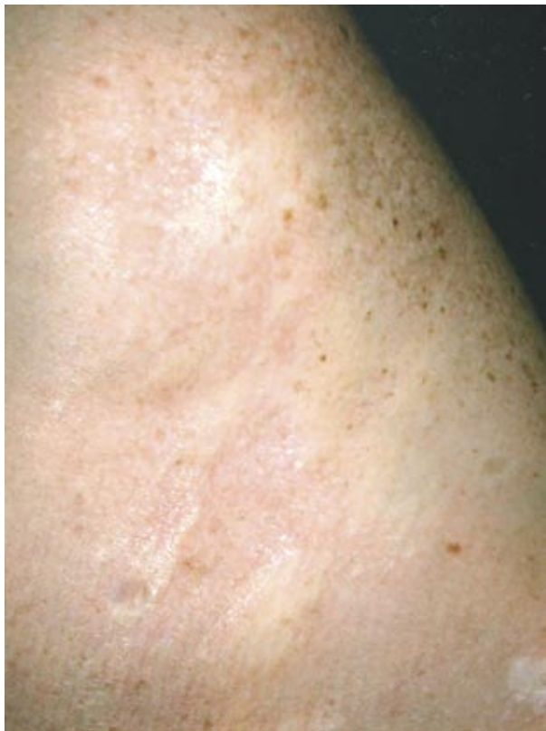
Figura 1. Placas y máculas brillantes, discrómicas en región torácica superior.