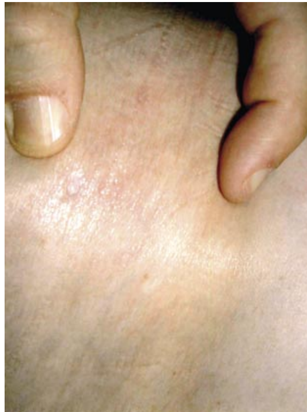
Figura 2. Mayor detalle donde se intenta representar la inducción de las lesiones.

reticulado blanquecino en mucosa yugal y leve microstomía (Figuras 1-3).