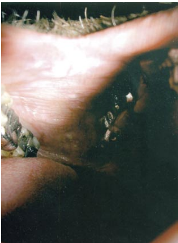
Figura 3. Reticulado blanquecino linquenoide en mucosa yugal.