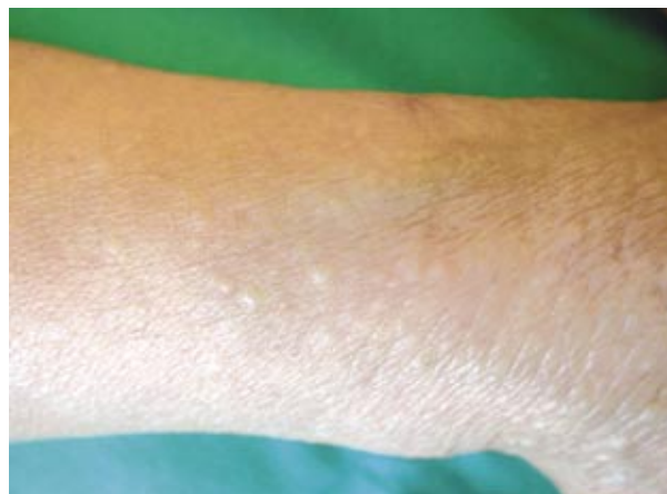
Figura 2. Detalle de lesiones papulosas.

mixedematoso o mucinosis papular, mucinosis folicular, mucinosis cutánea tipo placa, la forma juvenil autorresolutiva, del lactante, focal cutánea y escleredema.