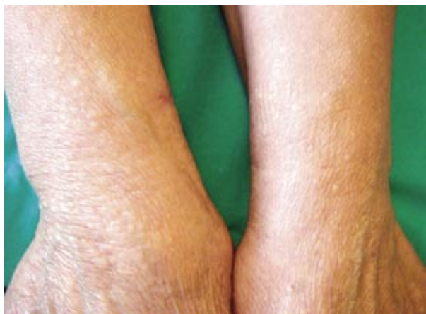
Figura 1. Pápulas color piel de 2 a 4 mm en tercio distal de antebrazos y dorso de muñecas, distribuidas de forma bilateral y simétrica.