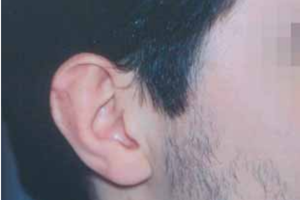
Figura 1. Aspecto clínico de la oreja derecha, que presentaba un abultamiento en la mitad superior de la concha. En el hélix se aprecia la cicatriz correspondiente a la biopsia.

ración hialina, acompañándose en ocasiones de un tejido de granulación. También puede haber fibrosis focal, sobre todo en los márgenes de la cavidad, principalmente cuando la lesión se prolonga en el tiempo[1].