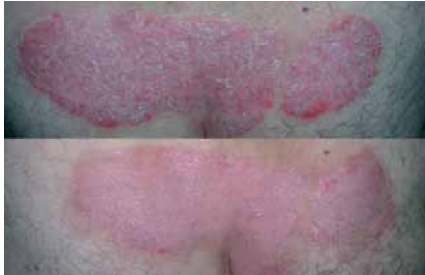
Figura 3. Placa psoriásica lumbar después de 10 sesiones de tratamiento. Se observó una disminución del espesor, infiltración, eritema y descamación.