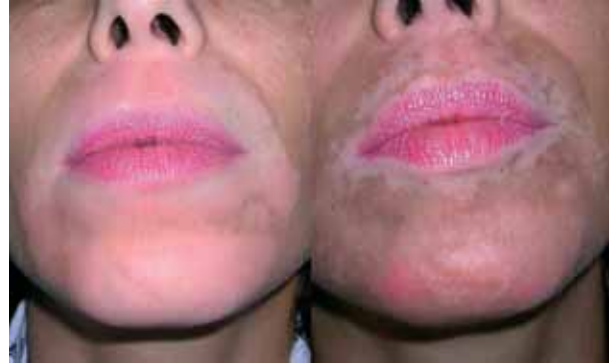
Figura 6. Vitiligo peribuca en el cual se evidencia pigmentación después de 12 sesiones.