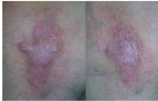
Figura 8. Liquen hipertrófico de 10 años de evolución en raíz de miembros inferiores. La aplicación de luz excimer MEL-308 nm. en 10 sesiones evidenció una disminución total de la sintomatología.