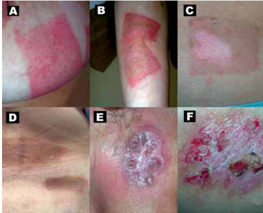
Figura 10. A: Eritema tras una semana de tratamiento de vitiligo mamario. B: Eritema postratamiento de eccema crónico de miembro superior. C: Tratamiento de lesión localizada de vitiligo en región lumbar. Nótese la hiperpigmentación del área irradiada (30 cm 2 ) tras una semana (5 MED). Una opción alternativa, es el bloqueo de la piel sin patología con cremas fotoprotectoras o cintas opacas. D: Hiperpigmentación de región lumbar. E: Postratamiento en región de mejilla derecha, con formación de lesiones ampollares situadas en área irradiada (10 MED). F: Formación de erosiones y costras sobre placa psoriásica, debido a la utilización de dosis altas (15 MED).

corto periodo para luego retomarlo son los que presentaron mejor y mayor respuesta al tratamiento.