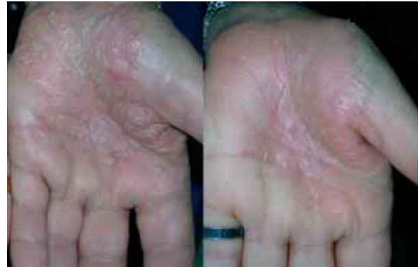
Figura 4. Psoriasis en palmas. Postratamiento de 10 sesiones, con excelente respuesta y una leve pigmentación residual.

sistemas de 308 nm. por tratar en forma exclusiva la piel afectada: menor dosis acumulativa en piel sana, menor cantidad de sesiones y reducción a largo plazo del riesgo de carcinogénesis.