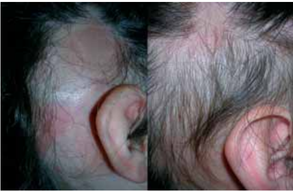
Figura 7. Paciente masculino de 12 años de edad con placas alopécicas en cuero cabelludo. Repoblación de las placas tras 10 sesiones