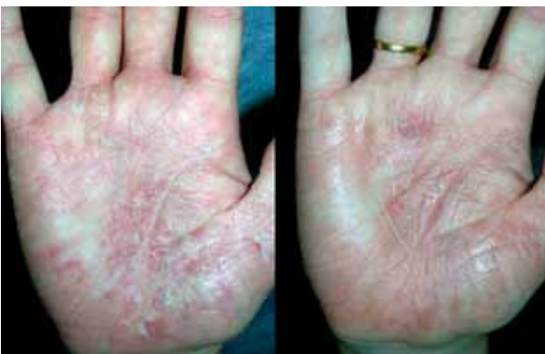
Figura 9. Eccema crónico en palmas, resultado postratamiento con 5 sesiones.

a mucosas, uñas y pelo. El LP oral ocurre entre un 60 a 70% de los pacientes con LP cutáneo, con posibilidad de presentarse como enfermedad oral localizada entre un 20 a un 30%. Posee predilección por la mucosa bucal, gingival y lengua. La terapéutica es generalmente paliativa y no curativa.