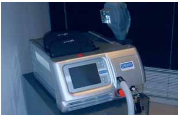
Figura 2. Lámpara de 308 nm. de xenon-cloruro (Xe-Cl) excimer (Excilite-u, Deka, Florencia, Italia)

Nuestro centro, Mondial Laser Clinics (Unidad académica de Medicina Láser del Servicio de Dermatología del Hospital Italiano de Buenos Aires, Argentina) cuenta con el 308-nm. xenon-cloruro excimer (Excilite-u, Deka, Florencia, Italia). Emite una intensidad hasta 50mW/cm 2 sobre un área de 30 cm 2 (spot de 5x6 cm), con lo cual nos aseguramos una mayor área de tratamiento con respecto a los sistemas láser, pudiéndo entregar mayor fluencia sobre las lesiones. También existe un sistema similar (Excilite; Deka, Florencia,