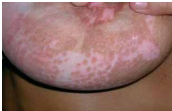
Figura 1. Vitiligo mamario. Tratamiento con MEL (Monochromatic Excimer Light) de 308 nm. (20 sesiones). Obsérvese el patrón de pigmentación en forma de islotes. .

El medio activo gaseoso de los sistemas de luz excimer de 308 nm. se compone de dos moléculas: un gas halogeno como el Cloruro de Hidrógeno (HCl), con un gas raro (inerte o noble) como el Xenón (Xe). Ambas moléculas se encuentran separadas en el estado de reposo, pero cuando son estimuladas eléctricamente, se unen formando una pseudomolécula o dímero. La palabra EXCI-MER es la abreviación de EXCited DiMER o dímero excitado . Ésta unión provoca la emisión de energía en forma de fotones a una longitud de onda de 308 nm., cercano al espectro de la luz ultravioleta B (UVB) de banda angosta (309-313 nm.).