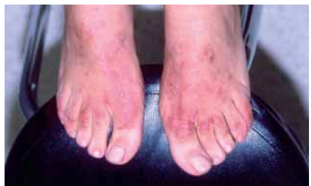
Figura 4. Dermatitis de contacto alérgica por parafenilenediamina contenida en el tinte del calzado.