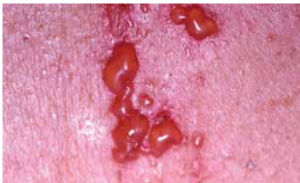
Figura 3. Reacción al patch-test con parafenilenediamina al 1% en vaselina.

1. No disponer a menudo de tiempo para concienciar a pacientes y dermatólogos de la necesidad ó no de realizar las pruebas epicutáneas. En este caso concreto tanto el dermatólogo como la paciente exigían la repetición del patch-test, por si encontramos algún alérgeno más que en el patch test anterior; sin tener en cuenta que podemos estar induciendo sensibilizaciones frente a otras sustancias que usamos en las baterías ya que frente a la PPD en una revisión de 10 años sobre 14.001 pacientes de los que 1.035 habían sido testados con PPD al menos en una ocasión el número de