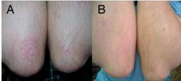
Figura 2. Evolución de placas de psoriasis estables en codos. A: Al inicio del tratamiento. B: a las 8 semanas.

tendencia a lo largo de las visitas a disminuir la puntuación PASI, es el grupo tratado con furfural sorbitol el que presenta medias inferiores en la cuarta y octava semana, a pesar de presentar un PASI superior al inicio del estudio (9'7 a 5'6).