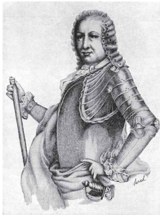
Figura 6. Marqués de Bobaella.

En 1937, se crean centros de diagnóstico en casos de dudas de los médicos de Asistencia primaria y así continúa la situación hasta la llegada de las sulfonas en que se dulcifica y temporaliza la obligada hospitalización y Orestes Díniz preconiza una descentralización, examen de los contactos, educación sanitaria de enfermos y de la población, y asistencia social, todo en coordinación de los médicos locales con un leprologo.