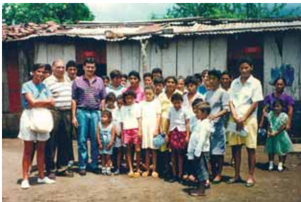
Figura 16. Nicaragua. Exploración de convivientes.