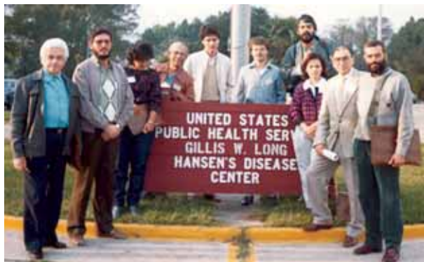
Figura 8. Carville.