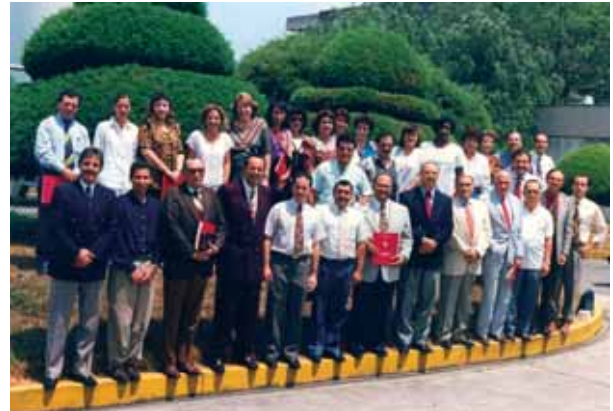
Figura 15. II Curso Internacional San José de Costa Rica.

Mencionemos algunas de las publicaciones leproológicas en América, muchas de ellas ya desaparecidas.