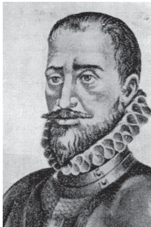
Figura 2. Gonzalo Giménez de Quesada.

Camagüey fue después de La Habana donde se descubrieron numerosos casos, aislándose en casas para negros y blancos, y en 1778 funcionaba un lazareto reedificado en