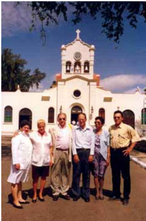
Figura 3. El Rincón.

Otro personaje importante de este período es Rafael Lucio (Figura 4), nacido en Jalapa (1819-1886), último director del Hospital de San Lázaro los últimos 19 años que en 1843 publica con Alvarado el “Opúsculo sobre el mal de San Lázaro o Elefanciasis de los griegos” forma manchada caracterizada por su carácter infiltrativo difuso, alteraciones