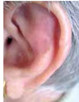
Figura 2. Placas eritematoinfiltradas en pabellones auriculares.

tiva de ribonucleótido en desoxirribonucleótido, y de esta manera quizá constituya el mecanismo cinético-limitante en la biosíntesis del ADN. El fármaco es específico, actúa en la fase S del ciclo celular y ocasiona detención en la interfase G1-S. Está indicado principalmente en leucemia granulocítica aguda y crónica, policitemia vera, trombocitosis esencial, síndrome hiperosinofílico, psoriasis, melanoma maligno metastásico, anemia drepanocítica e infección por VIH. Su principal efecto tóxico es la depresión hematopoyética[5], y se han descrito efectos mucocutáneos, entre los cuales encontramos xerosis, erupción liquenoide, alopecia, úlceras en dorso de manos y pies, hiperpigmentación y melanoniquia[6-11]. Los casos más frecuentemente reportados son asociados con dermatomiositis, y solo se ha reportado un caso de lupus eritematoso inducido por hidroxiurea en la literatura mundial[12].