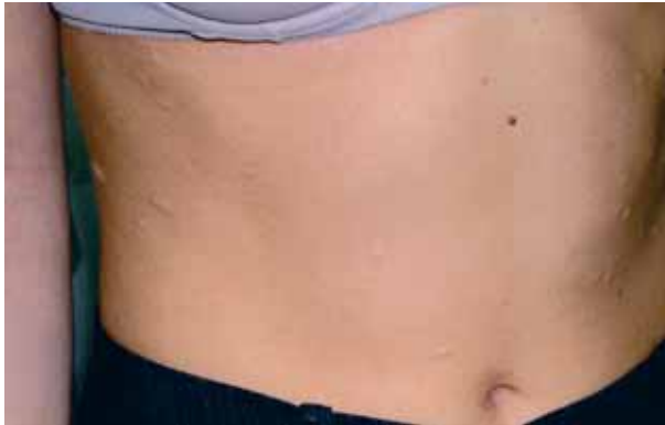
Figura 1. Lesiones blandas de aspecto protruyente en el tronco.

za escisión-biopsia de una de las lesiones localizadas en región subaxilar izquierda. El estudio histológico (Figuras 3 y 4) revela una epidermis normal, discreto engrosamiento de las fibras de colágeno y ausencia de células inflamatorias en la dermis. La tinción de ácido tricómico muestra una dermis de grosor normal detectándose una disminución y fragmentación de las fibras elásticas mediante la tinción de orceína con lo que se confirma el diagnóstico clínico de anetodermia.