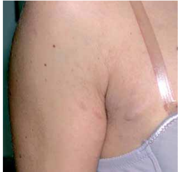
Figura 2. Máculas atróficas en la cara interna del brazo.

La anetodermia primaria es una rara alteración elastolítica de etiopatogenia incierta y discutida. En el año 1970, primero Edelson y Grupper[1] y posteriormente Kossard y cols.[1] demostraron la participación del sistema inmune en la etiopatogenia de esta enfermedad pero no pudieron justificar la asociación de esta alteración y la lesión clínica de anetodermia. Demostraron depósitos de IgM y C3 con patrón granular a lo largo de la unión dermoepidérmica de la piel afectada así como depósitos fibrilares en dermis y depósitos de C3 en