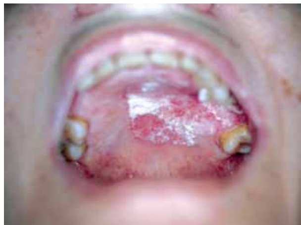
Figura 1. Lesiones blanquecinas leucoplasiformes afectando paladar duro.

Aunque el proceso se desarrolla lentamente va tener consecuencias fatales para el paciente. Las lesiones suelen ser multifocales y es raro que observen aisladas. Su localización electiva es la mucosa yugal, encías y suelo de boca. Durante su evolución pueden afectar otras zonas de la mucosa oral. La enfermedad se caracteriza por la presencia de vegetaciones papilares de base ancha y superficie verrucosa o polipoide formando masas de color blanco perlado, uniforme o rojo, con aspecto aframbuesado. Estas proliferaciones se desarrollan sobre una mucosa normal, leucoplásica o patológica[3]. Puede crecer a través de los tejidos blandos de la mejilla, penetrar dentro de la mandíbula o maxilar e invadir espacios perineurales. Tiene capacidad para dar metástasis locales en los linfáticos regionales, pero a distancia son poco frecuentes.