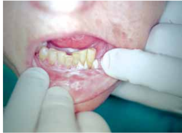
Figura 3. Formación de lesiones blanquecinas exofíticas típicas de papilomatosis oral florida en encía inferior.

La importancia de los carcinógenos ambientales en las neoplasias de cabeza y cuello se ha puesto de manifiesto, con una mayor frecuencia de mutaciones del gen supresor p53 que se ha encontrado en el 50% de los procesos malignos[5]. La pérdida de actividad de la proteína p53 se puede deber a esas múltiples mutaciones del gen p53 o a la acción de los virus que infecten la cavidad oral. El análisis de la alteración del gen supresor tumoral p53 proporciona información del diagnóstico, pronóstico y tratamiento de la enfermedad y además es un indicador de alto riesgo para los pacientes en los que conviene aplicar terapias adyuvantes más agresivas[6]. Aunque el tipo de vida constituye un importante papel etiológico, algunos pacientes pueden ser más susceptibles por su capacidad de metabolización de los agentes carcinógenos o procarcinógenos, lo que dificulta la capacidad de reparación del daño del DNA. La sobreexpresión de la proteína c-erbB-3 podría contribuir a la transformación maligna y al crecimiento tumoral, lo que supondrá un índice de malignidad durante la progresión de la hiperplasia verrucosa a CV y a carcinoma espinocelular bien diferenciado[7].