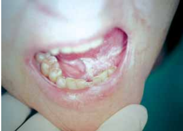
Figura 4. Formación tumoral leucoplasiforme que se correspondía con una neoplasia infiltrante de maxilar inferior.

El tratamiento de elección es la cirugía con extirpación amplia de las lesiones, reconstrucción y disección ganglionar si procede. Como tratamientos complementarios a la cirugía se pueden utilizar la laserabradación con láser de CO 2 y la criocirugía sólida. Los tratamientos médicos son decepcionantes por la falta de respuesta. Se han empleado \alpha -interferón, etretinato, citostáticos, 5-fluoruracilo, bleomicina y metotrexato, que sólo consiguen disminuir el tamaño tumoral, facilitando la cirugía posterior aunque no consiguen la remisión completa