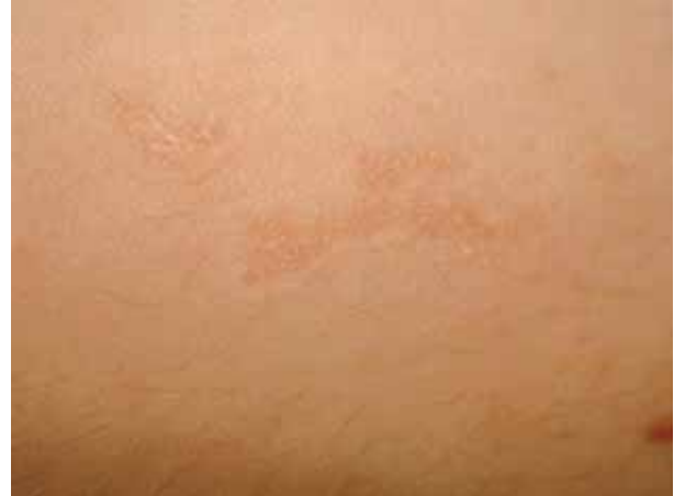
Figura 2. Aproximación. Se observa fino reborde sobreelevado.

lesión elemental era una pápula rosada con centro ligeramente deprimido y fino reborde anular sobreelevado (Figuras 1 y 2). Los diagnósticos clínicos incluyeron: nevo epidérmico lineal, poroqueratosis lineal y liquen eccematoide estriado.