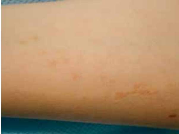
Figura 1. Lesiones de distribución lineal en antebrazo.