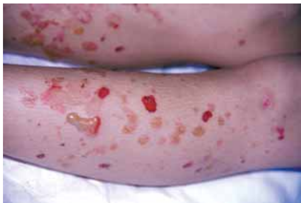
Figura 1. Ampollas serosas tensas sobre piel normal en extremidades inferiores.

importante afectación oral difusa que dificultaba la ingesta. El resto de la exploración física fue normal, sin objetivarse adenopatías ni visceromegalias. El estado general del niño estaba conservado y permanecía afebril.