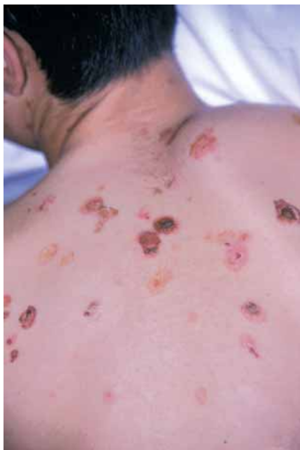
Figura 2. Ampollas, erosiones y costras serohemorrágicas en espalda.

El pénfigo vulgar es una enfermedad infrecuente en la infancia. En la literatura revisada hemos encontrado poco más de 50 casos[1-14], excluyendo las comunicaciones de pénfigo neonatal y fetos muertos intraútero.