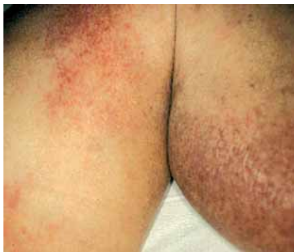
Figura 2. Placas inflamatorias de características semejantes.

El paciente fue trasplantado en el mes de noviembre del año 2000.