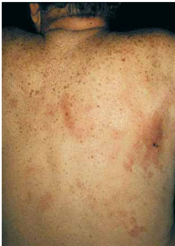
Figura 1. Máculas eritematopúrpúricas mal definidas.

típico signo de Romania o “Chagoma” en el cual evidencia la puerta de entrada del parásito. Esta etapa se caracteriza por parasitemia alta tanto en sangre como en los tejidos[1, 2, 8].