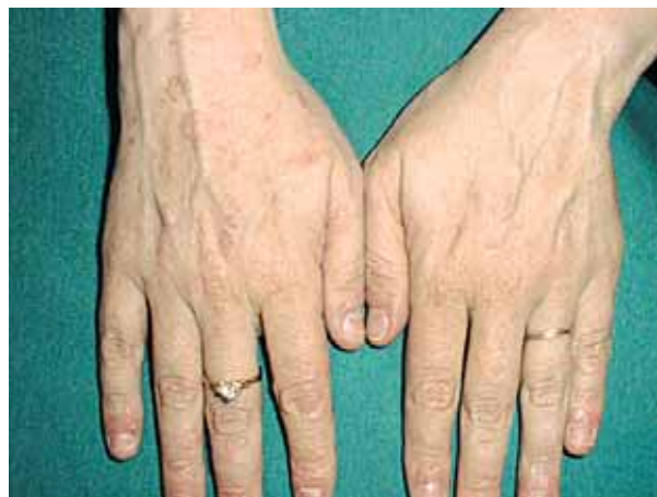
Figura 3. Máculas eritematoescamosas anulares.

La prevalencia de la PR en la población general se calculó en un 0,13% para los hombres y en el 0,14% para las mujeres. Puede afectar cualquier edad pero es más frecuente entre los 10 y los 35 años, afectando a hombres y mujeres de igual manera. Prevalce en zonas de clima templado, con mayor frecuencia en primavera y otoño. Se han comunicado verdaderos brotes epidémicos[2].