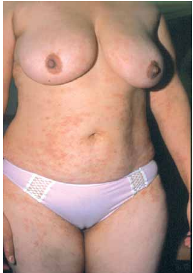
Figura 1. Lesiones purpúricas en tronco con distribución "en árbol de navidad".

lares levemente eritematosas, con borde descamativo y asintomáticas. Dichas lesiones presentaban aproximadamente 30 días de evolución (Figura 3).