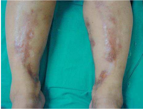
Figura 1. Lesiones esclerodermiformes lineales simétricas en regiones pretibiales.

En la exploración física presentaba, en los tercios distales de ambas regiones pretibiales, con distribución simétrica, lesiones nodulares profundas induradas que formaban bandas lineales de coloración amarillenta, con importante atrofia cutánea (Figura 1). Las lesiones eran dolorosas a la palpación.