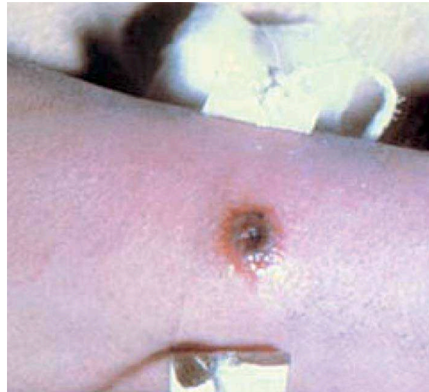
Figura 1. Pápula inicial de carbunco.

de la actividad de neutrófilos y al mismo tiempo interfiere con la producción de factor de necrosis tumoral, IL 6 y monocitos. La toxina del ántrax consiste en tres polipéptidos: el antígeno de proteína (PA, 83 kDa), el factor letal (LF, 90kDa) y el factor de edema (EF, 89 kDa)[6-7-8].