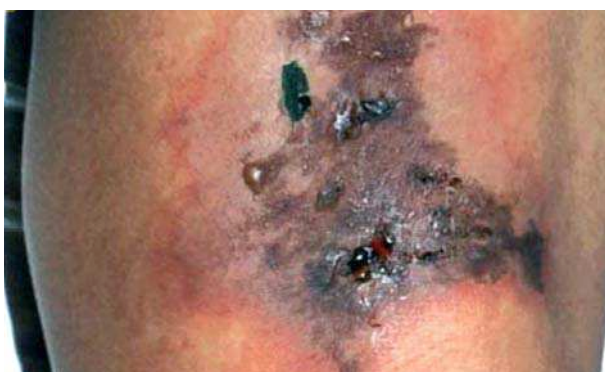
Figura 4. Exudado y lesión hemorrágica del ántrax cutáneo.

Resulta de la introducción de la espora a través de la piel, ya sea por medio de una picadura de insectos pre-