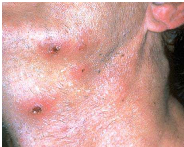
Figura 5. Forúnculos por estafilococo. Diagnóstico diferencial en el ántrax.

viamente infectados, permitiendo así a la bacteria entrar a la piel. La mayoría de los síntomas ocurren en sitios de exposición, brazos, manos, cara y cuello. La transmisión humano-humano es muy rara y esta asociada con pobre higiene en personas que portan casos de carbunco cutáneo[11].