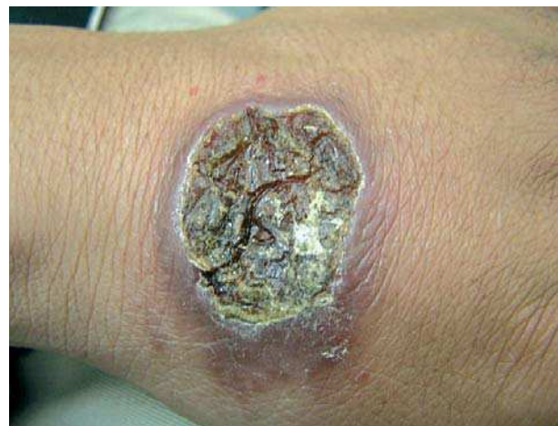
Figura 2. Lesión de leishmaniasis cutánea. Diagnóstico diferencial del carbunco.

Los animales se infectan posterior a la ingesta de la forma vegetativa o de las esporas. Si las esporas son ingeri-