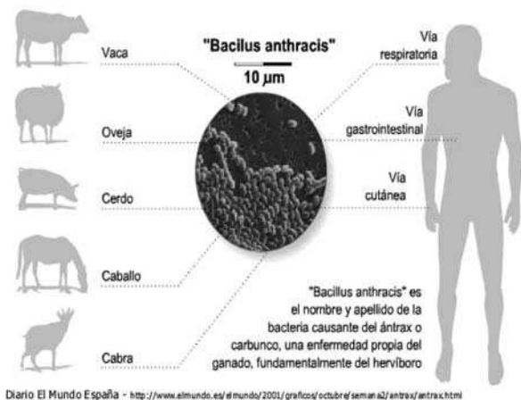
Figura 6. Órganos comprometidos en el carbunco.

Carbunco Pulmonar: Ingresa al organismo por inhalación a través del tracto respiratorio. Los síntomas iniciales pueden ser semejantes a los de la gripe común, después de varios días pueden progresar hasta causar problemas respiratorios severos. Suele ser mortal en el 90 a 100% si no hay un tratamiento a tiempo (Figura 6).