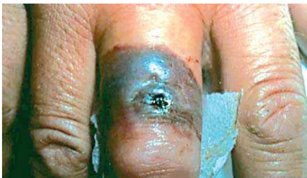
Figura 3. Ampolla hemorrágica del ántrax cutáneo.

das empieza la enfermedad del tracto intestinal con el desarrollo de septicemia.