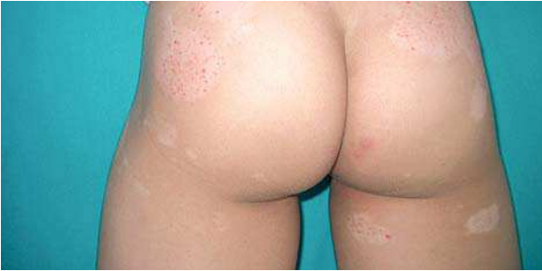
Figura 1. Áreas hipocrómicas y purpúricas en glúteos.

de Atresia de vías biliares, por lo que se apreciaba hepatomegalia con un hígado fibroso y colostásico. A los 3 meses de edad fue intervenida quirúrgicamente, realizándose una portoenteroanastomosis según técnica de Kasai. Desde entonces, presenta retraso ponderal y trombopenia con sangrado ocasional. Sigue medicación con ácido ursodeoxicólico para aumentar el flujo biliar y complejos vitamínicos.