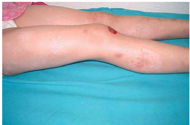
Figura 2. Áreas hipocrómicas y purpúricas en muslos y pantorrillas.

El primer caso de MFH corresponde a Ryan en 1973[6]. Se la considera infrecuente o poco diagnosticada. Su incidencia es mayor en la infancia y adolescencia[7], predominando en pieles oscuras[3, 5, 8], sólo se han descrito unos 16 casos en raza blanca de un total aproximado de 113 casos publicados[9]. Las lesiones hipopigmentadas de MFH pueden ser la única manifestación o asociarse a parches eritematosos, placas o tumores. Esta mezcla de eritema e hipopigmentación es la más frecuente, teniendo en cuenta que el eritema en pieles oscuras, a veces es poco perceptible[3].