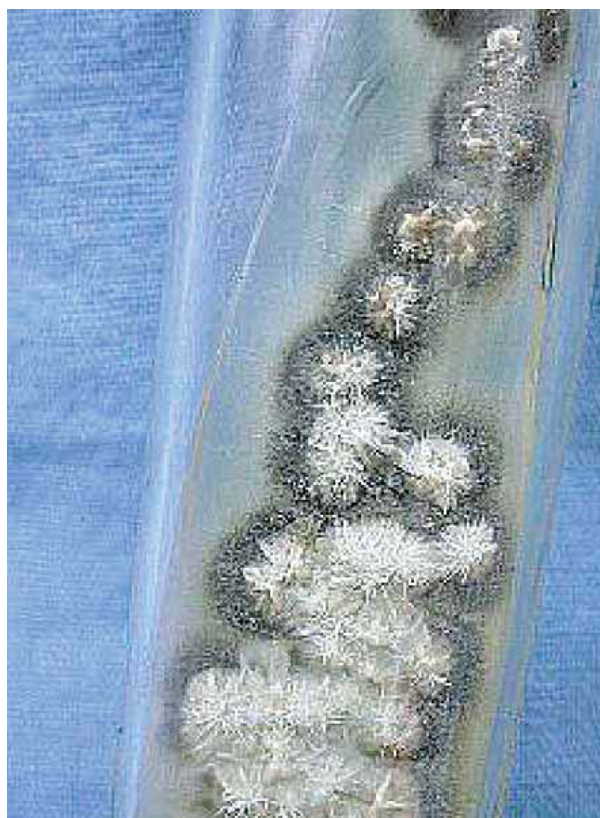
Figura 1. Cultivo de Sporothrix schenckii .

La esporotricosis en la infancia representa un reto diagnóstico, por lo diverso de su morfología, que incluye desde pequeños nódulos granulomatosos, hasta gomas y elementos ulcerosos diseminados, por esta razón Poletti et al. la citan como otro simulador clínico, en su informe de cuatro casos pediátricos, afectando dos las extremidades superiores uno el pie izquierdo y otro más el lado izquierdo de la cara, tratados 3 de ellos con itraconazol 3 mg/k/d[15].