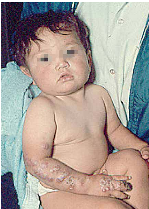
Figura 4. Esporotricosis linfangítica en miembros superiores.

Es interesante, hacer mención que entre los 13 y 15 años de edad encontramos el 32,4% de los casos, seguido del grupo de 10 a 12 años con el 27%, estos grupos de edad, nos