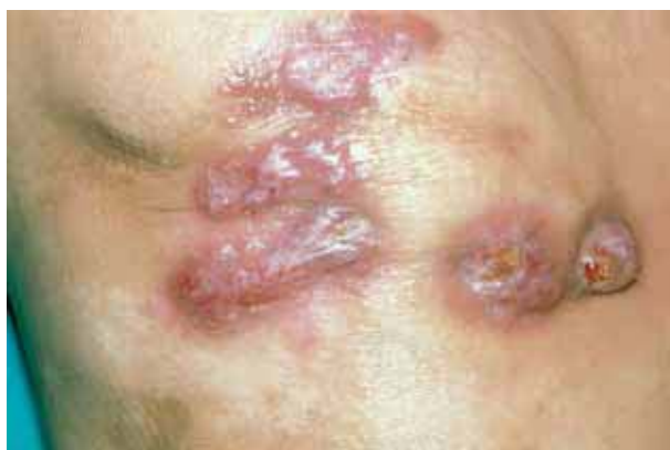
Figura 1. Aspecto clínico de la lesión en rodilla derecha.

Al no mejorar, la paciente fue remitida al servicio de Dermatología de Santiago de Compostela, presentando 6 tumoraciones nodulares eritematosas alguna de ellas cubierta de una costra hemorrágica y en la que podían advertirse pequeños orificios en la superficie por donde se obtenía un material purulento (Figura 1). La realización de un nuevo cultivo procedente de este material, así como la obtención de una nueva biopsia, permitieron identificar la presencia de