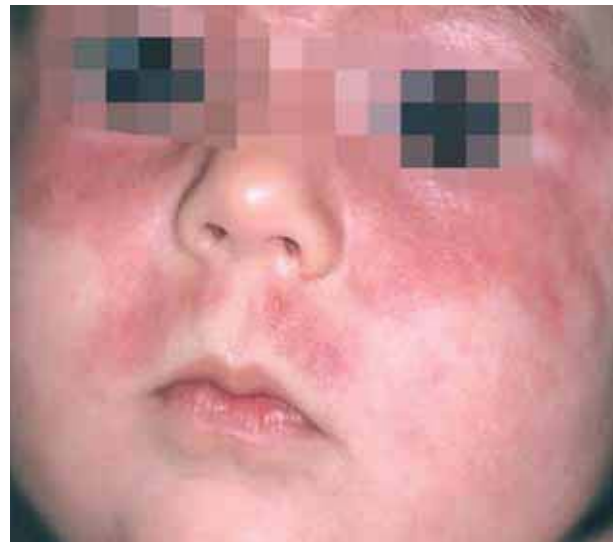
Figura 2. Placas similares de menor tamaño, en región supra-labial.

SSA/Ro, Ac. Anti-SSB/La, Ac. Anti-RNP, Complemento), así como estudio cardiológico (ECG, Ecografía doppler, Rx de tórax), siendo éstos dos últimos normales. Realizamos biopsia cutánea de la zona afecta, apreciándose degeneración vacuolar de la capa basal e infiltrado mononuclear en la dermis (Figura 3), datos compatibles con Lupus eritematoso neonatal. Instauramos tratamiento con esteroides tópicos de baja potencia (hidrocortisona 1%, 1 aplicación/ 12 horas) y medidas de fotoprotección. Las lesiones cutáneas remitieron totalmente a los 2 meses de instaurar el tratamiento y la leucocitosis, así como las enzimas hepáticas se normalizaron a los 10 meses de vida. Tras realizar seguimiento clínico durante 3 años, no se han producido recidivas clínicas.