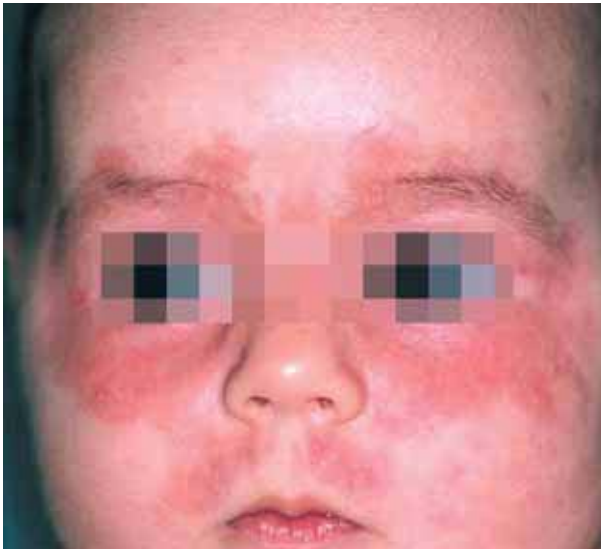
Figura 1. Placas eritemato-escamosas en forma de "antifaz".