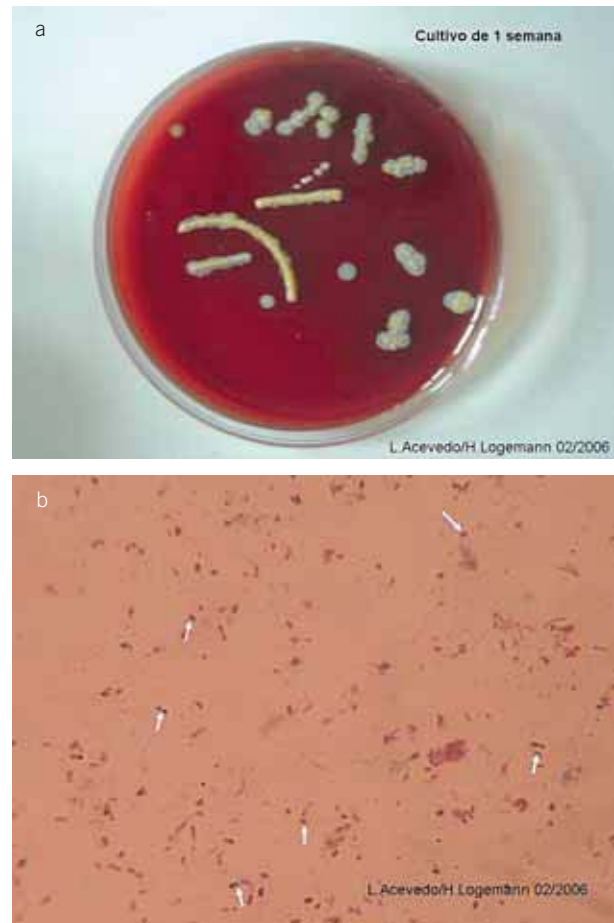
Figura 2. A) C. Tenuis : Cultivo demuestra colonias pequeñas, blancuecinas. B) C. Tenuis examen microscópico: figuras cocoides, difteroides.

El agente etiológico de la tricomicosis es Corynebacterium Tenuis . Es un microorganismo clasificado como Corinebacteria, acuerdo a tres condiciones: microscópicamente