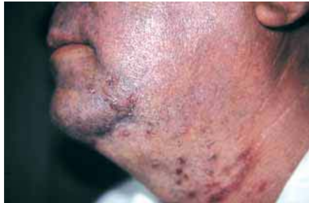
Figura 3. Seguimiento a los 10 días.