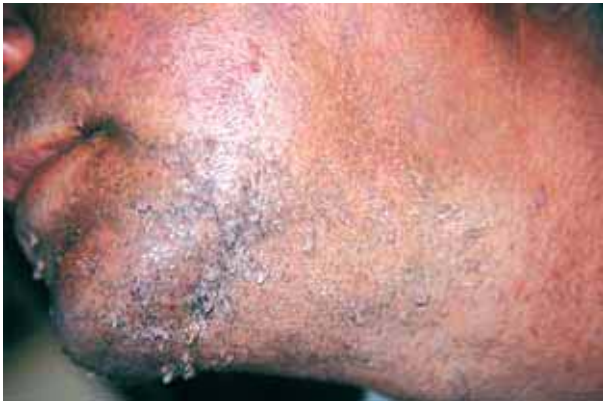
Figura 1. El paciente en la primera consulta.