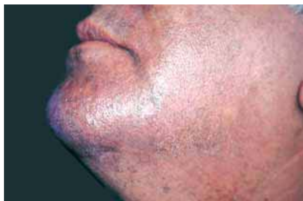
Figura 5. Control a los 30 días.

mera y segunda semana, con desaparición completa de las lesiones a los 30 días (Figuras 3, 4 y 5).