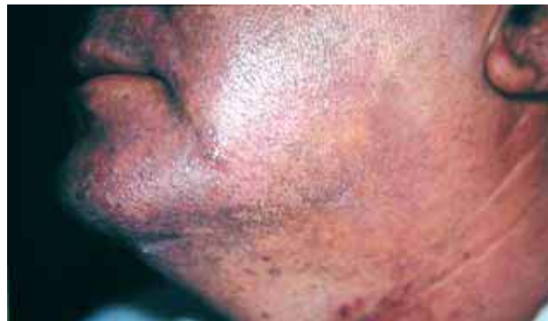
Figura 4. Seguimiento a los 20 días.