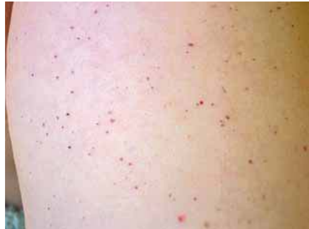
Figura 2. Detalle de las telangiectasias puntiformes.

Los exámenes de laboratorio mostraron los siguientes datos alterados: glucosa 124 mg/dl, colesterol 270 mg/dl, IgE específica a Anisakis 4,49 KU/l (valores normales: 0-0,35 KU/l), anticuerpos antitiroglobulina 614,60 UI/ml