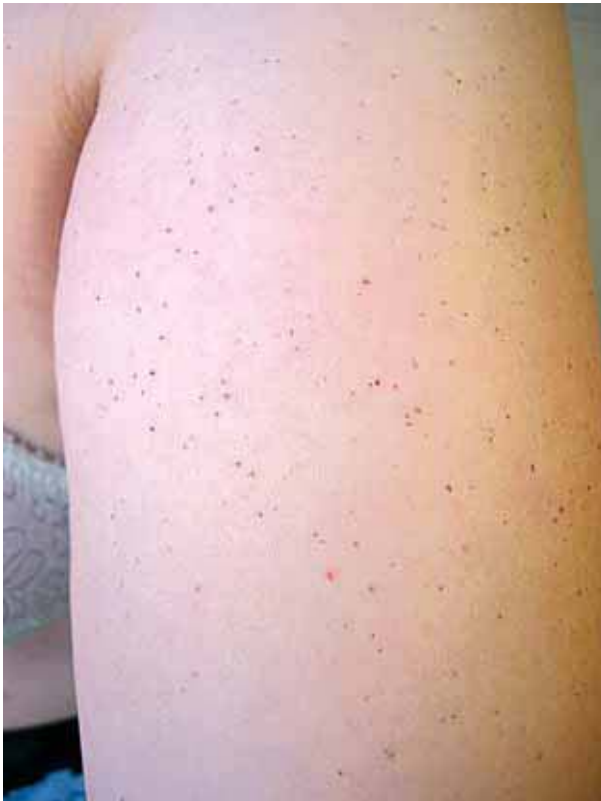
Figura 1. Telangiectasias en brazo.

todo momento. A la exploración física se apreciaban múltiples máculas puntiformes, milimétricas, purpúricas, no palpables en ambos brazos (Figuras 1 y 2). No presentaba lesiones en mucosas. Entre sus antecedentes destacaba una historia de urticaria y angioedema con síntomas digestivos por Anisakis, hernia discal, linfadenitis reactiva inespecífica, dislipemia y bocio multinodular autoinmune normofuncionante. No había recibido tratamiento con anticonceptivos orales, ni contaba alteraciones menstruales ni en la menopausia. No presentaba tampoco ninguna enfermedad dermatológica de interés. No había en su familia casos similares.