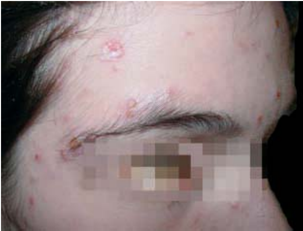
Figura 1. Pápula, vesículas e pústulas disseminadas na face.

Ao exame, presença de algumas pápulas eritematosas e pústulas isoladas de padrão folicular, dispostos unicamente na face. Ausência de adenopatia e sinais sistêmicos normais. O diagnóstico clínico foi de impetigo bolhoso. Conduzida com ácido fúsidico em pomada duas vezes ao dia, após uma semana, a paciente retorna com uma erupção polimórfica disseminada em face e tronco com pápulas, vesículas, pústulas e crostas (Figura 1 e 2). Permanecia assintomática e em bom estado geral. As hipóteses foram impetigo disseminado e varicela, sendo realizado estudo histopatológico que revelou acantólise, células multinucleadas e corpos de inclusão (Figura 3). Estabelecido o diagnóstico de varicela, foi introduzido famciclovir 250 mg 12/12 horas por 7 dias e higiene das lesões com água boricada. Após duas semanas, a paciente retornou sem lesões e ausência de complicações sistêmicas.