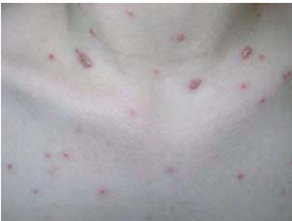
Figura 2. Erupção característica da varicela em tronco.

Ao exame, presença de algumas pápulas eritematosas e pústulas isoladas de padrão folicular, dispostos unicamente na face. Ausência de adenopatia e sinais sistêmicos normais. O diagnóstico clínico foi de impetigo bolhoso. Conduzida com ácido fúsidico em pomada duas vezes ao dia, após uma semana, a paciente retorna com uma erupção polimórfica disseminada em face e tronco com pápulas, vesículas, pústulas e crostas (Figura 1 e 2). Permanecia assintomática e em bom estado geral. As hipóteses foram impetigo disseminado e varicela, sendo realizado estudo histopatológico que revelou acantólise, células multinucleadas e corpos de inclusão (Figura 3). Estabelecido o diagnóstico de varicela, foi introduzido famciclovir 250 mg 12/12 horas por 7 dias e higiene das lesões com água boricada. Após duas semanas, a paciente retornou sem lesões e ausência de complicações sistêmicas.