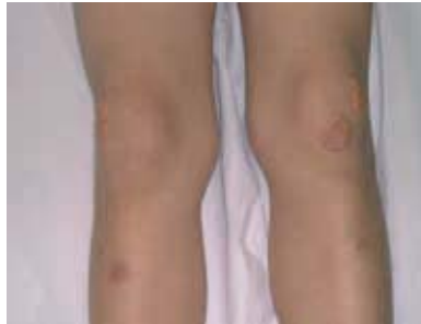
Figura 1. Xantomas tuberosos en ambas rodillas.

Se estudió en endocrinología pediátrica donde se le realizó un estudio analítico