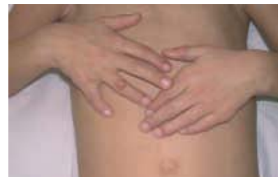
Figura 3. Xantomas planos en todos los espacios interdigitales (xantomas intertriginosos) y un xantoma tendinoso sobre la articulación interfalángica proximal del 4º dedo de mano derecha.

El tratamiento más eficaz es la aféresis de LDL, técnica que consiste en la extracción de las lipoproteínas que contienen apo B-100[9]. El tratamiento farmacológico con estatinas más un secuestrador de los áci-