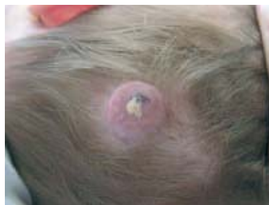
Figura 1. Tumor eritemato-violáceo a nivel occipital.

Describimos el caso de una lactante de 6 meses de edad con miofibromatosis múltiple con lesiones cutáneas y óseas, en la que se descartó la afectación visceral.