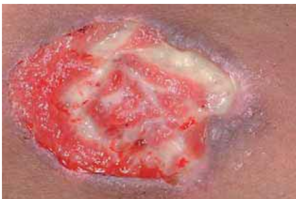
Figura 1. Lesão ulcerada, fundo com secreção sero-purulenta, bordas infiltradas, localizada no braço. Paracoccidioidomicose & SIDA.