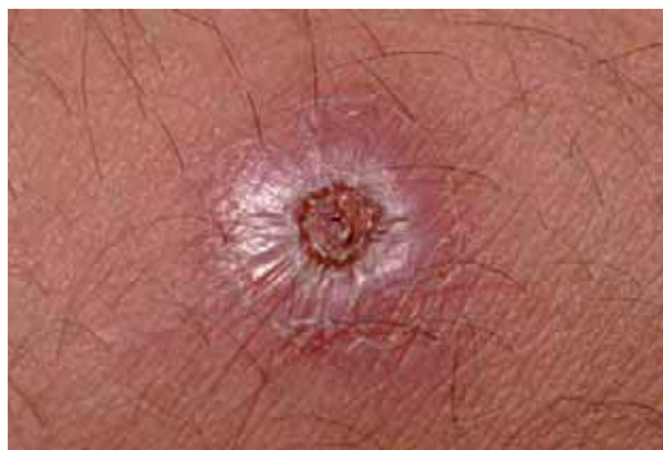
Figura 3. Lesão infiltrada, centro ulcerado, localizada na perna. Paracoccidioidomicose & SIDA.

demonstrar que, independente da idade do paciente, a imunossupressão induzida pelo VIH tende a provocar quadro clínico de paracoccidioidomicose disseminada, grave e com altos índices de mortalidade[43]. Esses informes tornam imperativos, nos países endêmicos, a suspeita e o diagnóstico precoce da paracoccidioidomicose como doença oportunista associada ao VIH. E, naqueles países não endêmicos, a inclusão da paracocci-dioidomicose como possibilidade diagnóstica quando da assistência a pacientes sabidamente infectados pelo VIH ou com histórico de imunossupressão, quando procedentes ou com histórico de trabalho em países endêmicos[42].