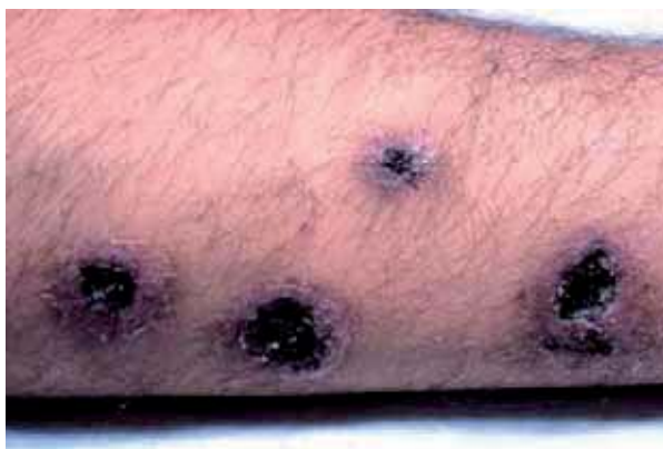
Figura 5. Lesões úlcero-necróticas, borda infiltrada, localizadas na perna. Esporotricose & SIDA.

O presente artigo atualiza os dados de Bustamante e colaboradores até o presente [67, 68]. A idade média dos 34 pacientes foi de 39,4 anos, variando de 11 a 71 anos, com 31 homens para três mulheres (M/F = 31/3). Em vários casos o diagnóstico da esporotricose disseminada ou com manifestações atípicas foi o alerta para possível imunossupressão