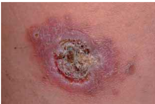
Figura 2. Lesão infiltrada, centro ulcerado recoberto por crostas, localizada na perna. Paracoccidioidomicose & SIDA.

Esporotricose é enfermidade causada por espécies de fungo dimórfico do gênero Sporothrix spp , de vida saprobiótica no solo, vegetais e vegetais em decomposição. É de distribuição universal e mais prevalente nos países tropicais e