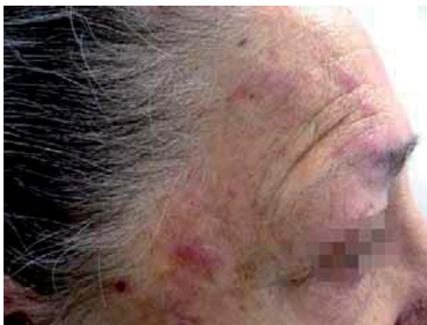
Figura 1. Placa frontotemporal derecha con nódulos eritematosos de consistencia elástica.

y de tacto gomoso de 5 x 6 centímetros, con pérdida parcial del pelo detrás de la línea de implantación frontal (Figura 1). No se palpaban adenopatías locorregionales.