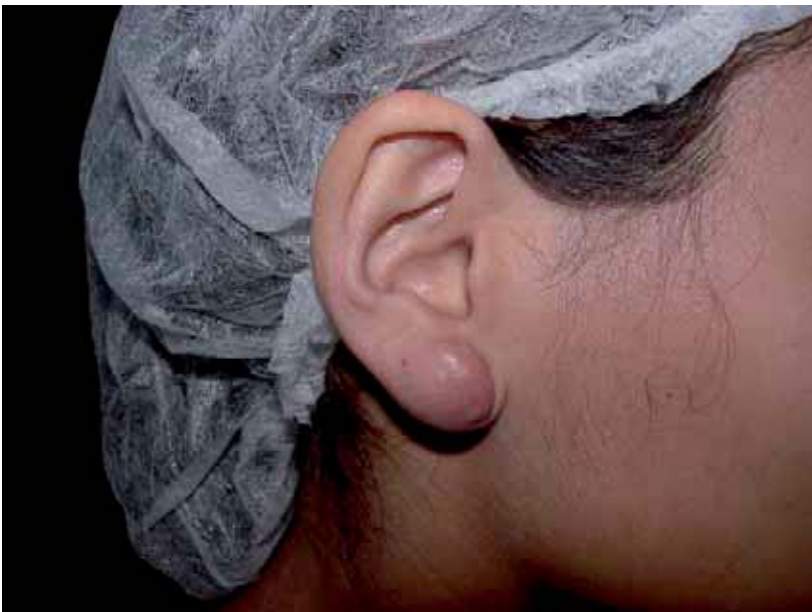
Figura 1. Quelóide auricular.

O quelóide é caracterizado histologicamente pela grande quantidade de fibras colágenas e matriz celular glicoprotéica. A patogenia é permanece controversa. Contudo, existe uma coerência em creditar um distúrbio genético nos fibroblastos. Os fibroblastos modificados sintetizam colágeno vinte vezes mais que num processo cicatricial normal. Após o trauma, o processo de cicatrização inicia-se com a fase inflamatória caracterizada principalmente pela vasodilatação e liberação de fatores quimiotáxicos para células inflamatórias e fibroblastos. O fator de transformação de crescimento beta possui forte poder quimiotáxico para fibroblastos e o estimula a síntese de matriz intercelular. Sabe-se também, que em indivíduos predispostos, os fibroblastos migrados persistem por mais tempo no processo cicatricial, principalmente na neocapilaridade[5].