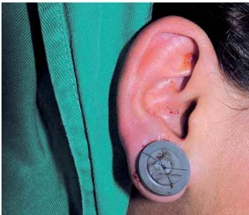
Figura 3. Pós-operatório de seis meses.