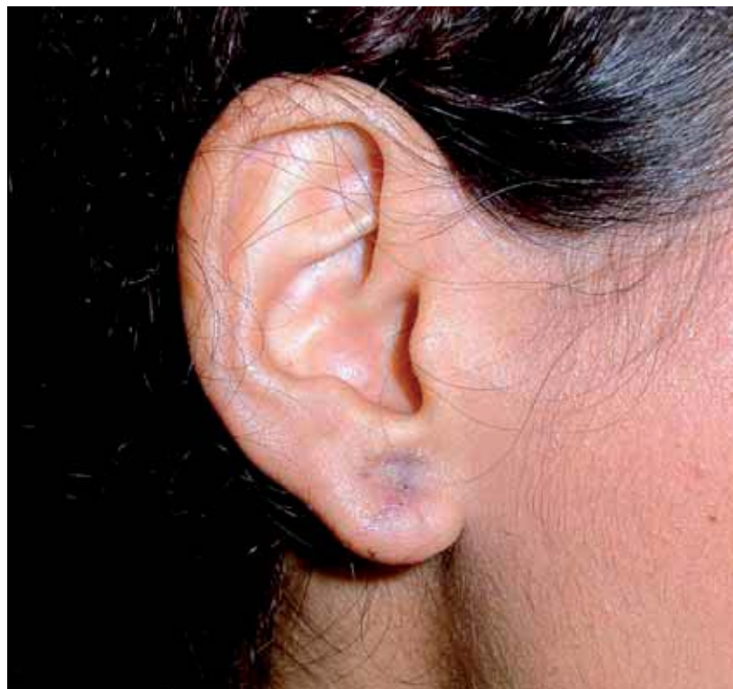
Figura 4. Pós-operatório de seis meses.

A introdução de um dispositivo que permita uma adequada compressão cirúrgica nas fases iniciais de cicatrização pode auxiliar na redução da recorrência do quelóide. Assim, ao dispor uma palheta de borracha, obtida de um frasco anestésico, que é fixado na ferida cirúrgica através de suturas acessórias em "X", se obtém o efeito compressivo.