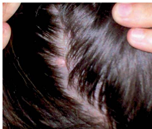
Figura 1. Lesión clínica de sebaceoma.

A pesar de tratarse de una enfermedad benigna al paciente se le realizaron los siguientes estudios complementarios, tales como: análisis de sangre (serie hemática y hemoquímica) e imagenológicos (radiografía de tórax, ultrasonido abdominal). Todos los resultados se encontraron dentro de límites normales.