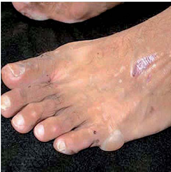
Figura 1. Lesões vesíco-bolhosas no dorso do péis.

Imunofluorescência direta da bolha detectou imunoglobulinas IgG, IgA, IgM e C3 no interior e na parede dos vasos e na junção dermo-epidérmica.