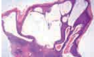
Figura 2. Vasos linfáticos irregulares, dilatados, en la dermis papilar y reticular sin afectación del tejido subcutáneo. En los vasos linfáticos presencia de linfa, leucocitos y neutrófilos.

tejido subcutáneo (Figura 2). El resultado del examen histopatológico fue compatible con el diagnóstico de linfangioma. La correlación clínica, analítica y histopatológica de nuestro paciente permitió establecer el diagnóstico definitivo de linfangioma circunscrito (LC) del pene. El tratamiento realizado fue la ablación de las lesiones con láser de dióxido de carbono (Figura 3). No se observaron recurrencias.