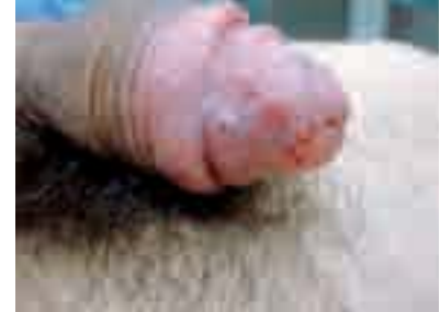
Figura 3. Un mes después de la ablación de las lesiones con láser de dióxido de carbono.

Como opciones de tratamiento se incluye la extirpación del tejido afecto, la ablación con láser de dióxido de carbono (CO 2 ), la escleroterapia, radioterapia, crioterapia y la fulguración con electrocauterio[1-5]. Las recidivas locales son comu-