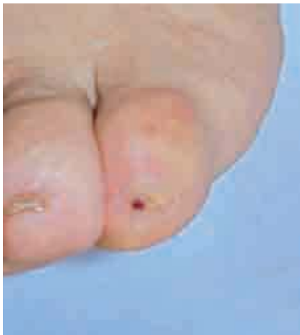
Figura 1. Nódulo eritematoso en uña del 5.º dedo del pie izquierdo.

bacterias (Figuras 3 y 4). En el lecho ungueal se observa una dermis con proliferación de vasos capilares de neoformación, de endotelio prominente y microfocos de calcificación.