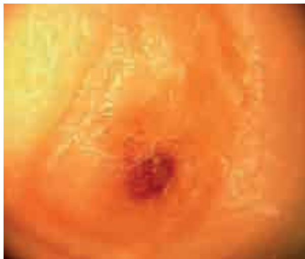
Figura 2. Dermatoscopia: punto rojo central con vasos tortuosos y hemorragia puntiforme. Obsérvese la destrucción de la lámina ungueal.

Clínicamente se presenta como un nódulo eritematoso, doloroso y no pulsátil, localizado habitualmente en palmas y